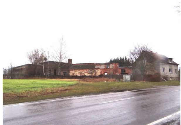
Ortseinfahrt Reesen aus Richtung Burg mit Standort

Der Geltungsbereich des Bebauungsplanes Nr. 102 besitzt eine Flächengröße von insgesamt ca. 7.300 m 2 .