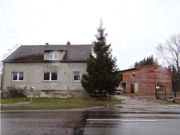
vorhandene brach gefalle bauliche Anlagen des Standortes

Aus Sicht der Stadt Burg wird, mit der langfristigen Revitalisierung und Inwertsetzung eines brach liegenden und bereits baulich in Anspruch genommenen Standortes, ohne für eine erforderliche Erweiterung baulicher Nutzungen neue Flächen in Anspruch zu nehmen oder einen neuen Standort an anderer Stelle zu entwickeln, insbesondere dem Gebot des sparsamen und schonenden Umganges mit Grund und Boden gemäß § 1a (2) BauGB Rechnung getragen (Vorrang der intensiven gegenüber einer extensiven Siedlungsentwicklung).