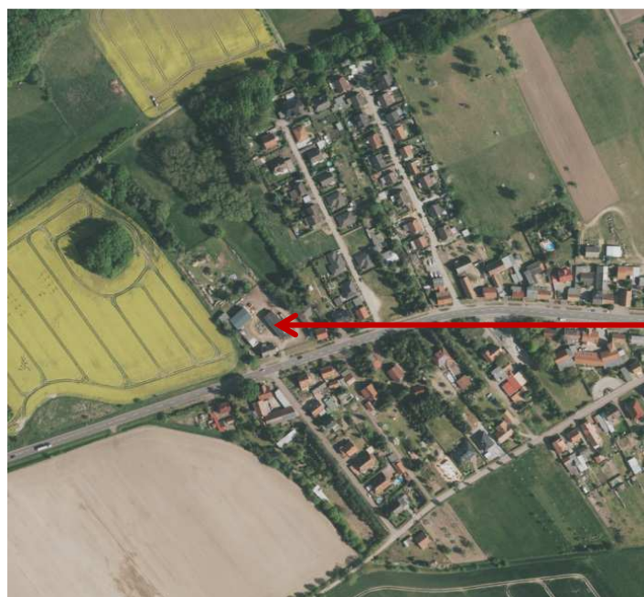
Lage des Plangebietes in der Ortslage Reesen

Der räumliche Geltungsbereich des Bebauungsplanes Nr. 102 „An der Berliner Chaussee“ (OT Reesen) umfasst Teile der Flurstücke 347/4 und 505/347 der Flur 4, Gemarkung Reesen. Er verfügt über eine Gesamtgröße von ca. 7.300 m 2 . Die Flächen des Geltungsbereiches stellen brachgefallene bauliche Anlagen aus einer aufgegebenen landwirtschaftlichen Nutzung dar. Hier befinden sich ehemalige Garagen und Werkstattgebäude, ein ehemaliger Waschplatz für Fahrzeuge und Geräte sowie ein Wohngebäude. Ein Teil der Gebäude wird derzeit, in Vorbereitung der Nachnutzung, gesichert und saniert, um die Erhaltung sicherzustellen.