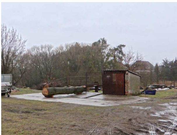
der ehemalige Waschplatz im rückwärtigen Grundstücksteil