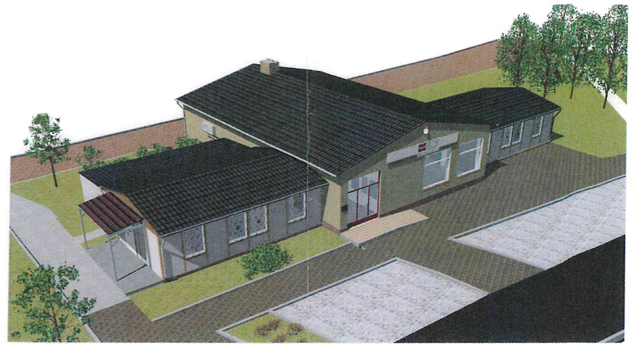
Perspektive von Süden M ohne