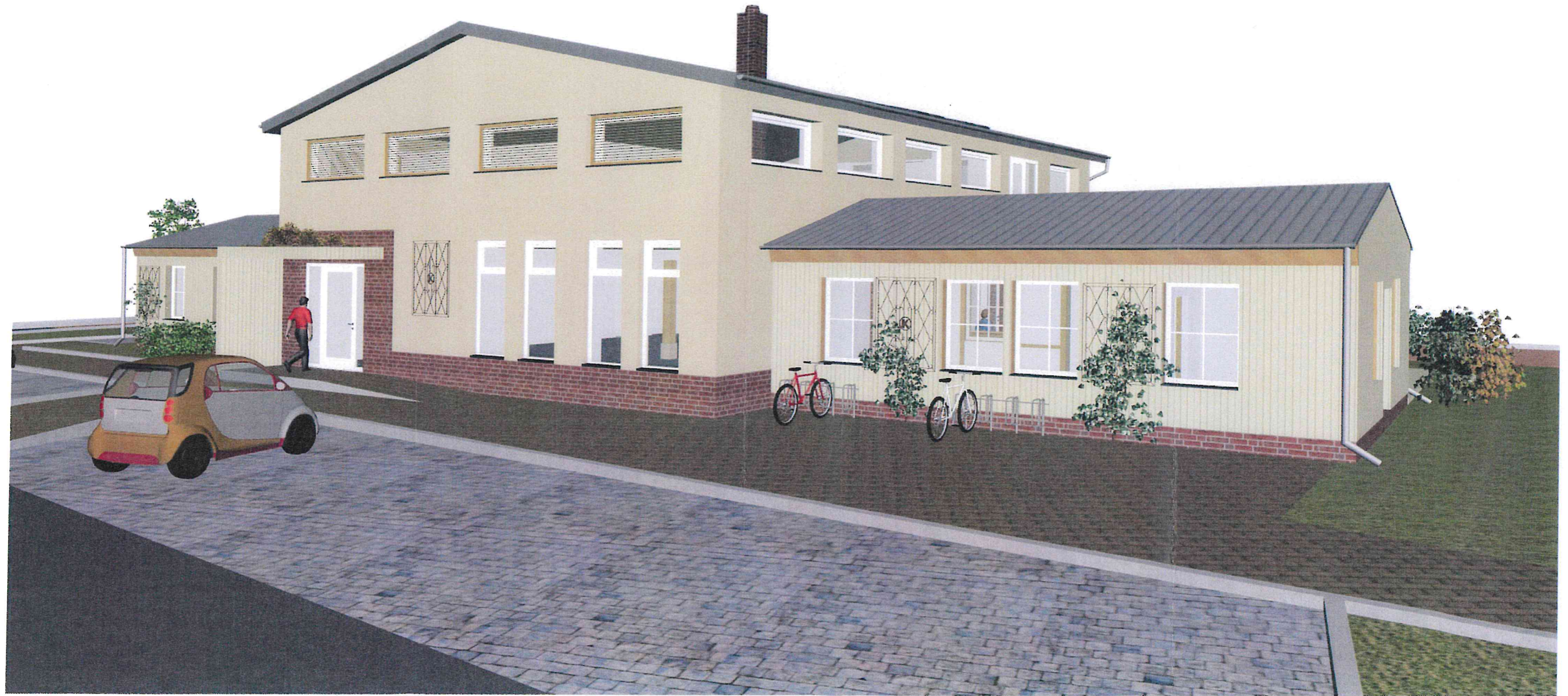
Fassadengestaltung Putz - Wiedererkennungswert "Konsum" und Klinker in Anlehnung an den Dorfcharakter