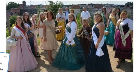
Königliche Hoheiten aus ganz Sachsen-Anhalt gaben sich auf dem Weinberg ein Stelldichein und wurden anschließend von Gästeführer Wolfgang Teile der Burger Altstadt gab es auf der Bühne Inter Vorstellungen.